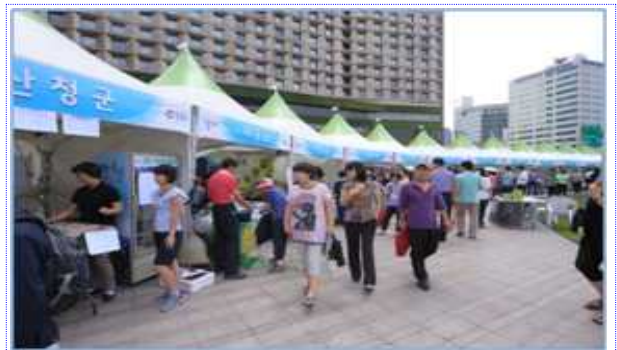
서울광장 판매부스 전경