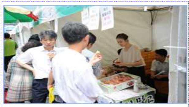
청계광장 판매부스 전경