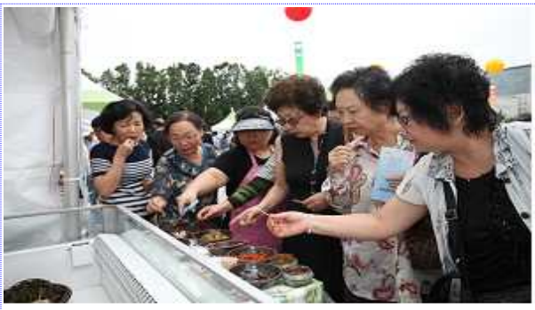
서울광장 무료시식 코너