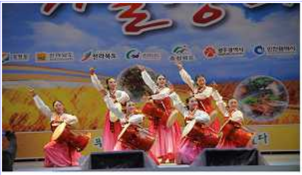
내 고장 홍보의 날 행사