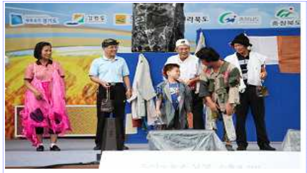
시민들과 함께하는 마당놀이한마당