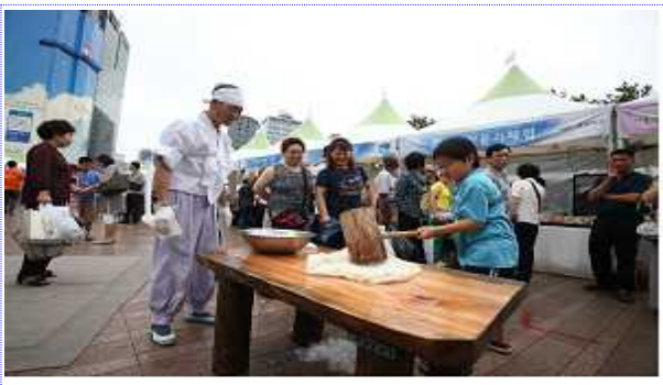
체험행사 떡메치기 장면