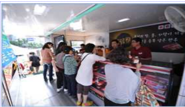
특장차 판매부스 전경