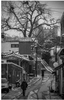
제생동천길 중앙고등학교로 올라가는 종로구 계동 언덕길 ©