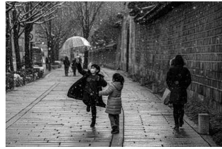
삼청동천길 눈 내리는 날 종로구 소격동 경복궁 돌담길에서 만난 개구쟁이들