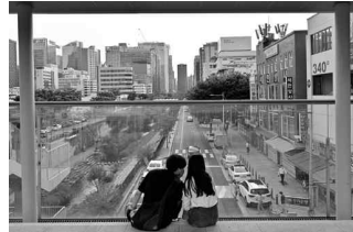
필동천길 필동천이 청계천에 합류하던 지점에 만들어진 세운상가 ©