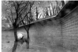
정릉동천길 가을에 내리는 중구 정릉대왕궁 돌담길