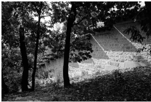
흥덕동천길 흥덕동천 상류 서민수가 발원하는 종로구 명륜3가 창덕궁 돌담 ©