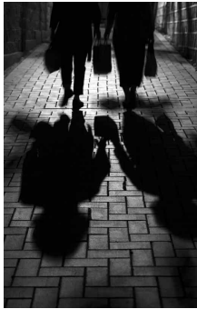
안국동천길 늦은 밤, 벽돌이 깔린 종로구 안국동 골목길을 걷어가는 부부