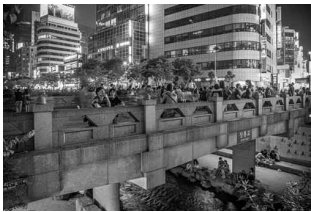
남산동천길 중구 삼각동 남산동천이 청계천에 합류하던 지점의 장흥교 ©