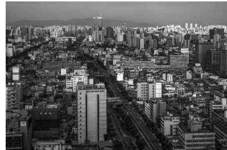
청계천 한양도성 안 여러 물길이 모여 흐르던 청계천