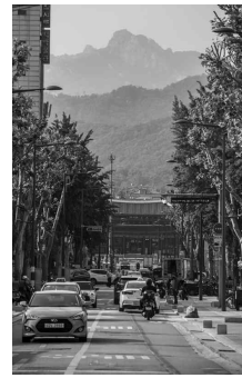
북영천길 종로구 외룡동 북영천길옆 돈화문로에서 본 창덕궁 돈화문과 북한산 보현봉 ©