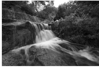
옥류동천길 종로구 옥인동 인왕산 기슭 옥류동천이 발원하는 수성동 계곡 ©