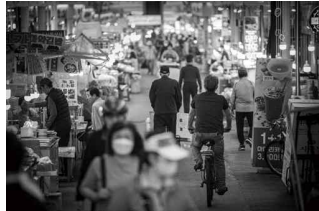
무사동천길 서울에서 가장 큰 건어물 시장인 중구 오장동 중부시장 ©