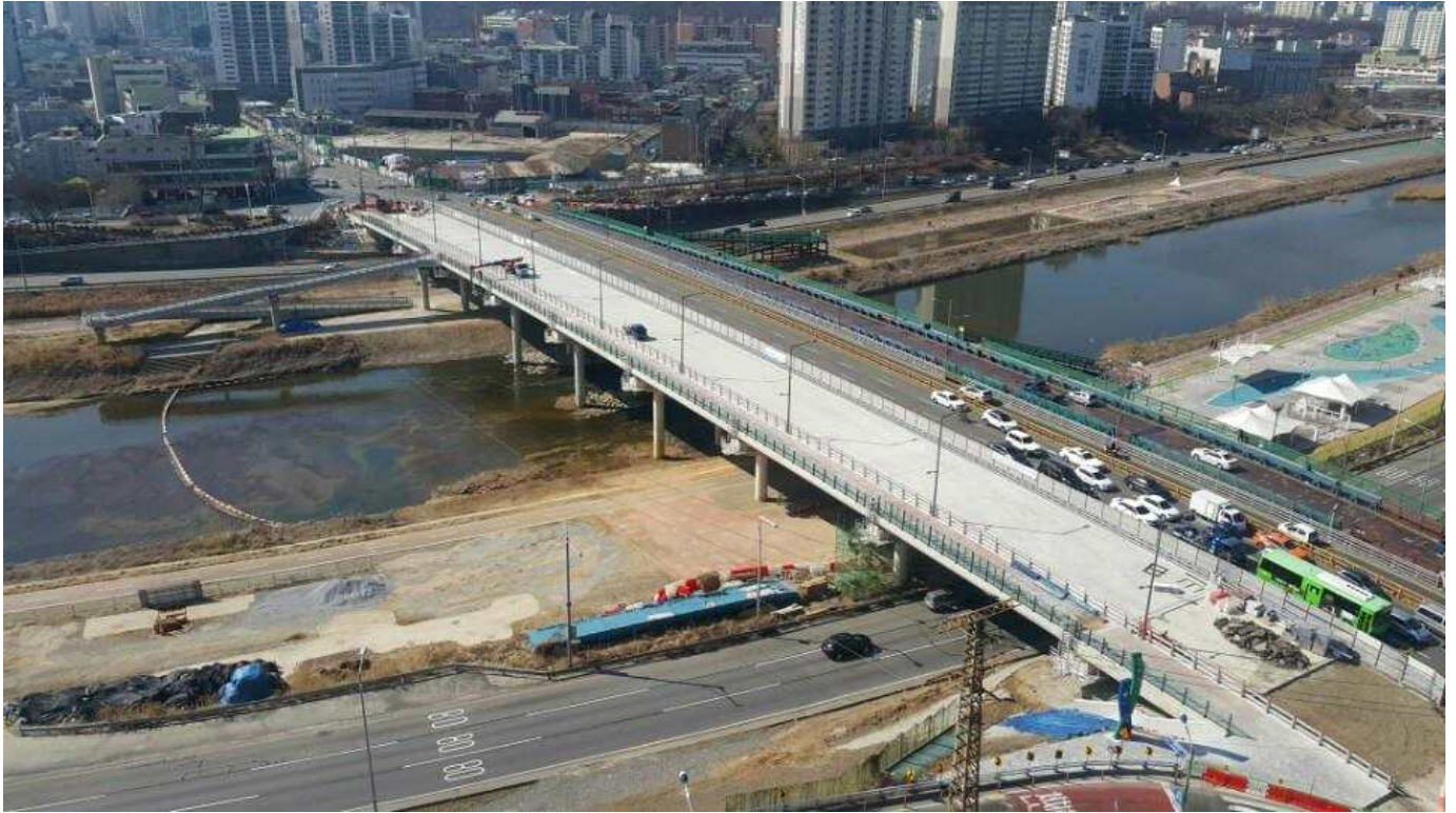
(공사현황 전경, 2017. 2.27)