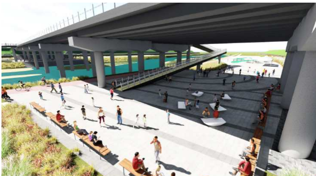
교량하부 수변공간 조성