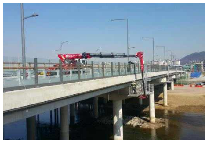
(교량 측면 조명공사)