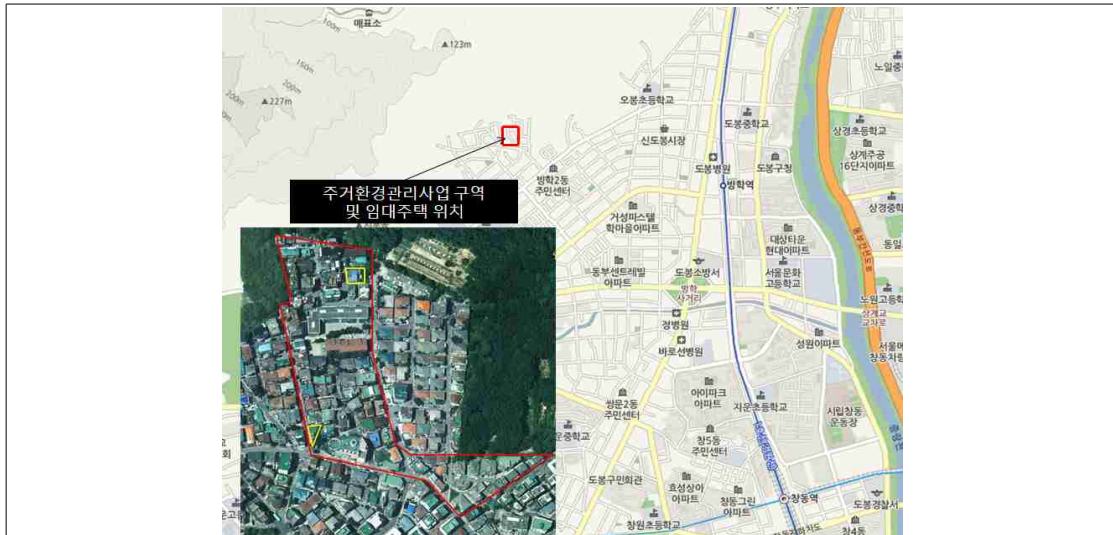
방학동 주거환경관리사업 구역 및 대상주택 위치